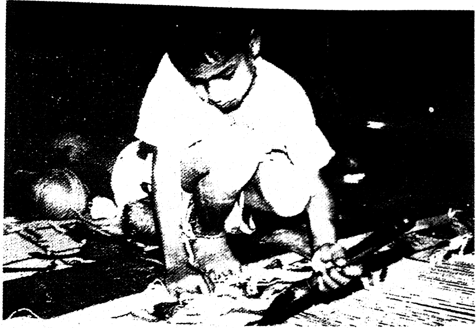
10. कलोन बनाने में लगा बच्चा